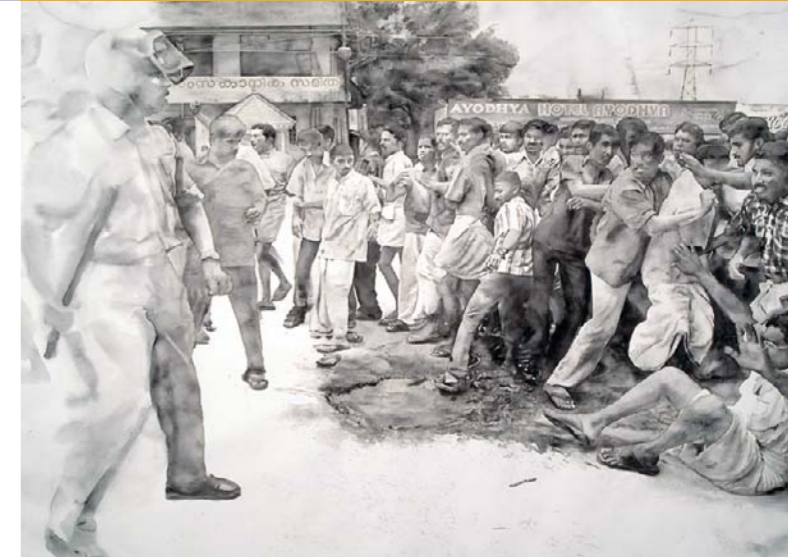
Sheela Gowda, 2/7 , 2006