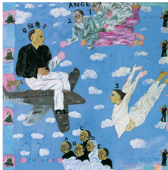
Arpita Singh, Thirty Six Clouds: Yudhishtira Approaching Heaven , 2005

The works in this show also reflect on what it means to live in a place that has always been both vulnerable to and enriched by heterogeneity. And in response to the times, what it means to inhabit not one, but many intersecting, overlapping and disconnected maps, and the effects that might have on the personal, social, political and economic life of the country.